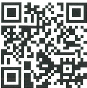
QR Code ศูนย์ความเป็นเลิศด้านชีววิทยาศาสตร์.png 1K